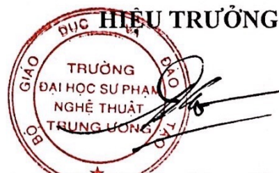
PGS.TS Đào Đăng Phụng