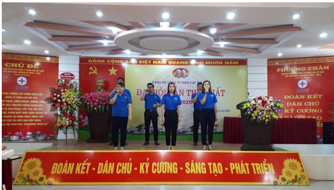
Hình 4: Đoàn thanh niên Công ty Điện lực Mỹ Đức tham gia văn nghệ