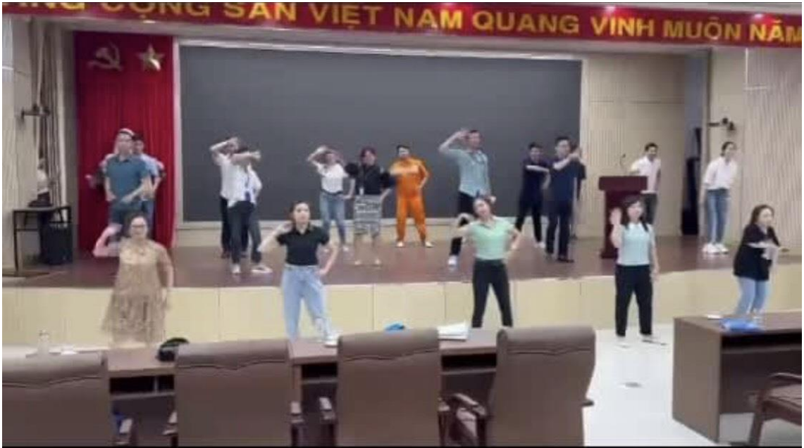
Hình 9: Một buổi tập văn nghệ của cán bộ, công nhân viên