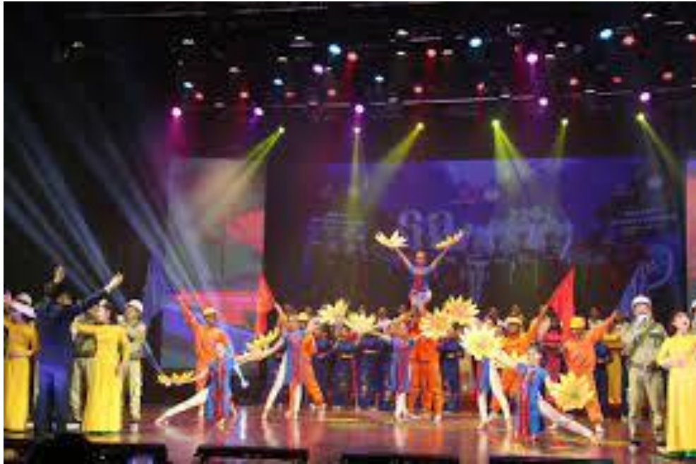
Hình 1. Hoạt động văn nghệ quần chúng phục vụ mục đích chính trị