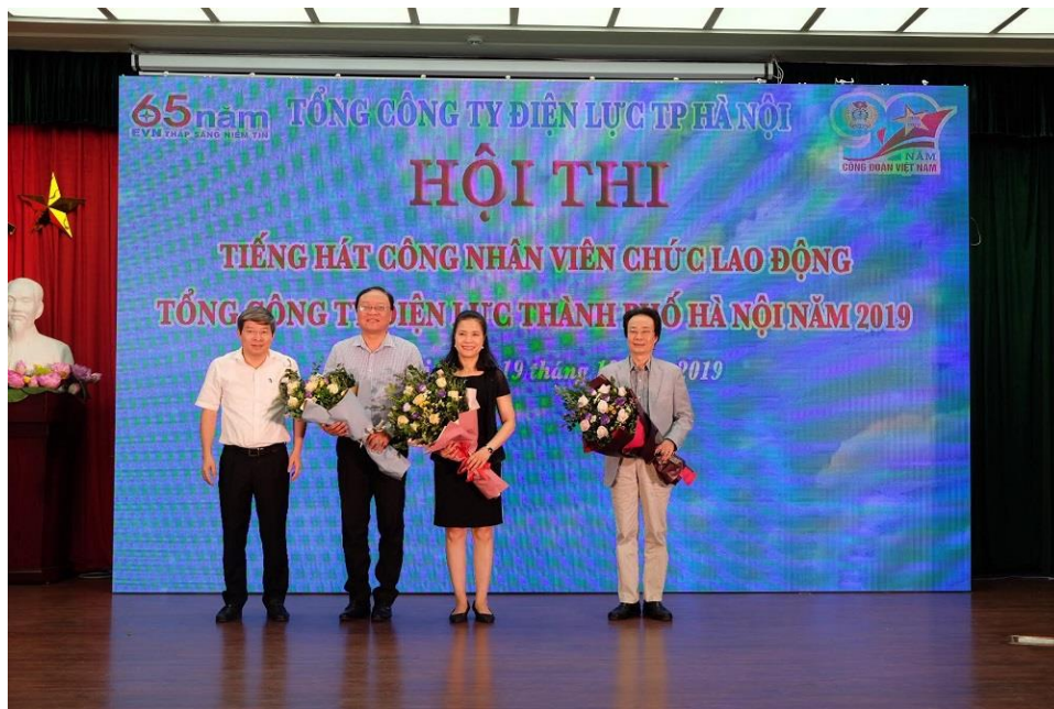
Hình 3: Hội thi tiếng hát công nhân viên chức lao động Tổng công ty Điện lực Thành phố Hà Nội năm 2019