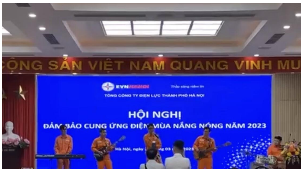
Hình 2: Hoạt động văn nghệ quần chúng phục vụ mục đích chính trị