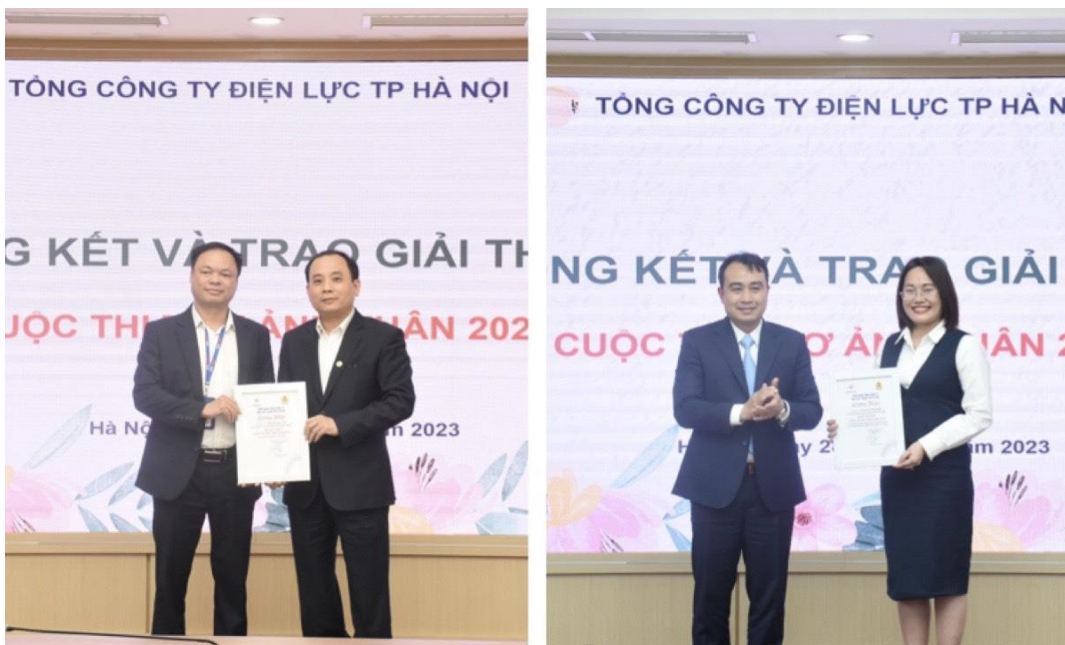
Hình 8: Công đoàn Tổng công ty Điện lực Thành phố Hà Nội trao giải cho các tác giả giành giải Nhất hạng mục thơ và ảnh của Cuộc thi Thơ - Ảnh Xuân 2023