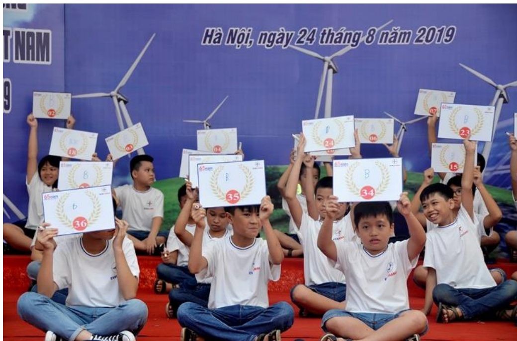
Hình 6: Ngày hội Văn hóa Tổng công ty Điện lực Hà Nội