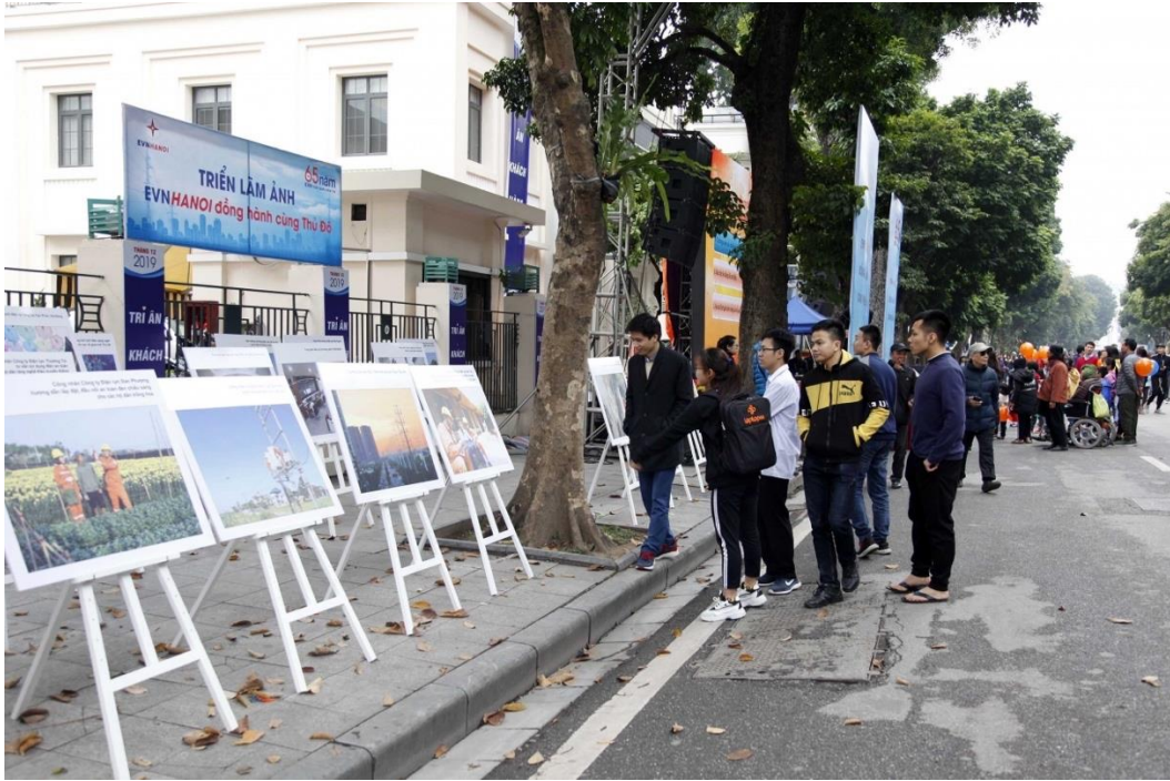
Hình 5: Khu vực triển lãm ảnh “EVNHANOI đồng hành cùng Thủ đô”