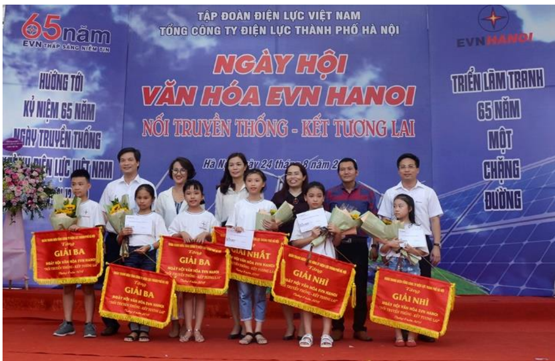
Hình 7: Trao giải cho các em đoạt giải vẽ tranh nhân kỷ niệm 65 năm