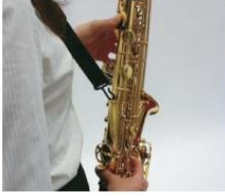
Vị trí ngón tay cái bên trái