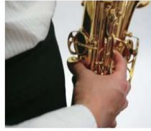
Vị trí ngón tay cái bên trái

Lấy hơi bụng: Đặc trưng của kiểu lấy hơi này là sự tham gia tích cực của cơ hoành. Khi hít vào cơ hoành hạ xuống ép vào khoang bụng và như vậy các thành bụng được đẩy ra phía trước, đồng thời các xương sườn dần rộng ra. Khi thở ra, các xương sườn phía dưới ép chặt, cơ hoành hơi nâng lên phía trên ép vào phổi từ phía dưới và làm cho